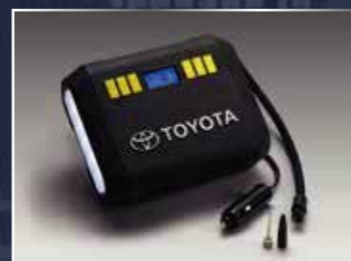
BƠM LẤP ĐIỆN TỬ