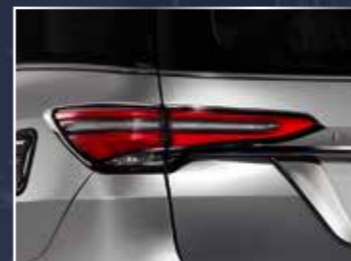
VIỀN TRANG TRÍ ĐÈN HẬU (MẠ CRÔM) (2 CHIẾC/BỘ)