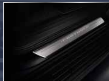
ỐP BẠC LÊN XUỐNG (4 CHIẾC/BỘ)