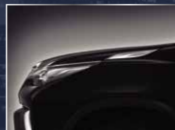
ỐP TRANG TRÍ NẮP CA-PÔ MẠ CRÔM (2 CHIẾC/BỘ)