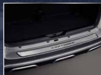
ỐP BẠC LÊN XUỐNG BẢO VỆ CẢN SAU