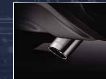
CHỤP ỐNG XẢ