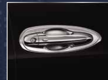
BỘ ỐP TAY CỬA MẠ CRÔM - 4 CỬA (CÓ VIỀN MẠ CRÔM)