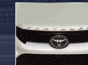
BIỂU TƯỢNG FORTUNER (CRÔM)