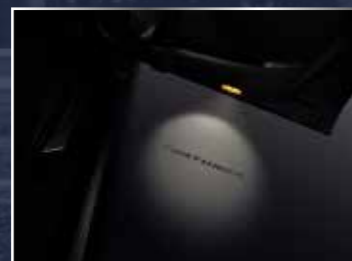
ĐÈN CỬA HIỆN CHỮ (1 ĐÈN/BỘ)