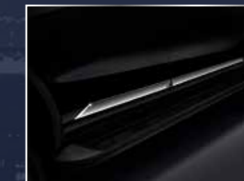
BỘ ỐP SƯỜN XE MẠ CRÔM (2 BÊN)