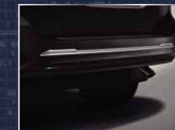
ỐP TRANG TRÍ CẢN SAU MẠ CRÔM