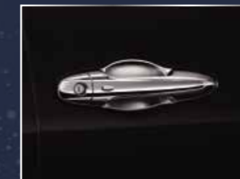
BỘ ỐP TAY CỬA MẠ CRÔM - 4 CỬA (CHỈ CÓ CHÉN CỬA)