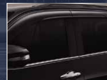
VÈ CHE MƯA