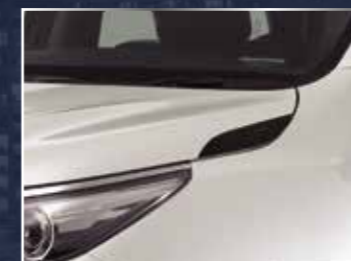
ỐP TRANG TRÍ NẮP CA-PÔ (MÀU GHI XÁM) (2 CHIẾC/BỘ)