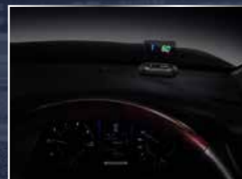
BỘ HIỂN THỊ TỐC ĐỘ