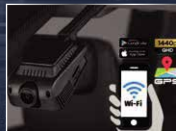
CAMERA HÀNH TRÌNH PHÍA TRƯỚC (GEN 3)