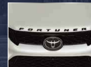
BIỂU TƯỢNG FORTUNER (ĐEN)