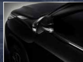
GẤP GƯƠNG TỰ ĐỘNG