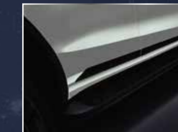
BỘ ỐP SƯỜN XE (MÀU GHI XÁM) (2 BÊN)