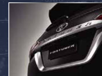
ỐP TRANG TRÍ BIỂN SỐ SAU MẠ CRÔM