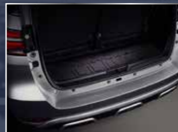
KHAY HÀNH LÝ